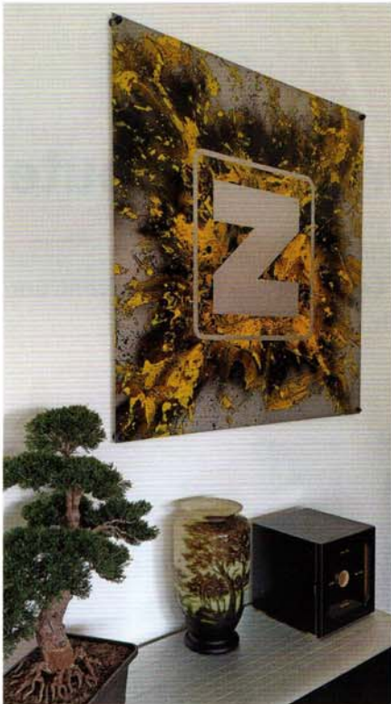
Gemälde von Petra Suk finden sich in Manager*innen-Büros, Seminarräumen und Entrées. „Sie leben. Es kommt immer auf den Lichteinfall an.“ (im Bild: „Z“, ein Auftragswerk von Zgonc)

erzählt von ihrer Tochter Svenja, die auch sehr gerne malt. „Im Moment sind es Figuren und Regenbögen. Wenn ich bei meinen Platten sitze und die Farbteile mit dem Stift umrande, kommt sie oft und fragt, ob sie mir helfen darf. Sie fasst dann einen Farbleks nach und ist darauf sehr stolz.“